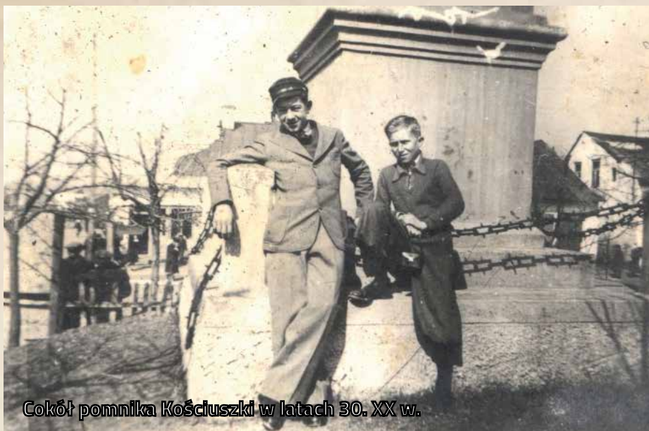
Cokół pomnika Kościuszki w latach 30. XX w.

Cały ogół oraz okoliczne włościanstwo wykazało wielkie zainteresowanie obchodem stuletniej rocznicy zgonu Naczelnika Narodu, Tadeusza Kościuszki. Tymczasowy Komitet spełniając ogólne życzenia miasta Opola i ludności okolicznej,