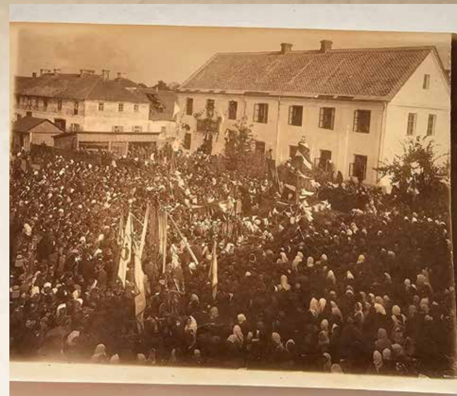
Opole Lubelskie 1917 r. Nowy Rynek