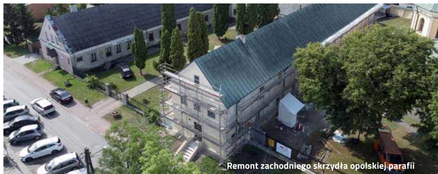
Remont zachodniego skrzydła opolskiej parafii