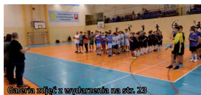
Galeria zdjęć z wydarzenia na str. 23

wszystkim integracja i dobra zabawa, to jednak emocji sportowych nie brakowało. Na wszystkich uczestników czekała także strefa zabaw, poczęstunek złożony z produktów lokalnych, a na zakończenie także potrawy z grilla.