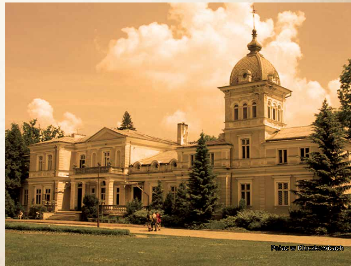
Pałac w Kluczkowicach